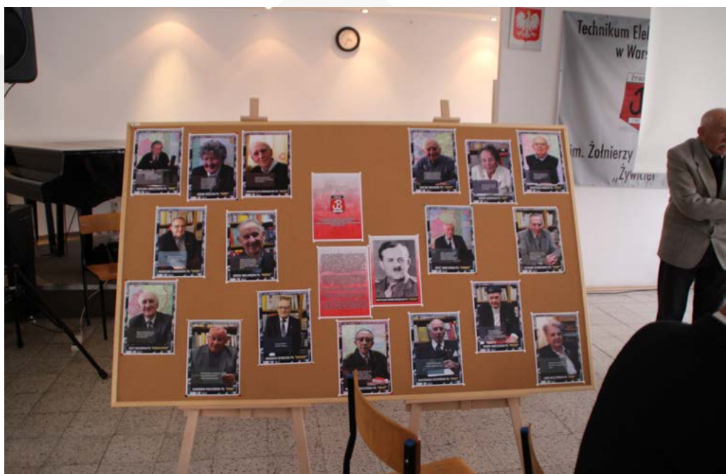
Szkolna izba pamięci – wystawa zdjęć kombatantów

Dla nas – nauczycieli i jednocześnie opiekunów projektu – największą nagrodą były łzy wzruszenia w oczach Powstańców i podziękowanie za zainteresowanie ich przeżyciami. Kombatanci przekazali nam również przesłanie, aby dbać o miejsca