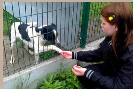
Wolontariat w Schronisku dla Zwierząt w Bydgoszczy

i spędzania czasu wolnego. Udowadniają, że bycie harcerzem uczy samodzielności, współpracy, odpowiedzialności, rozwija pasje i zainteresowania.