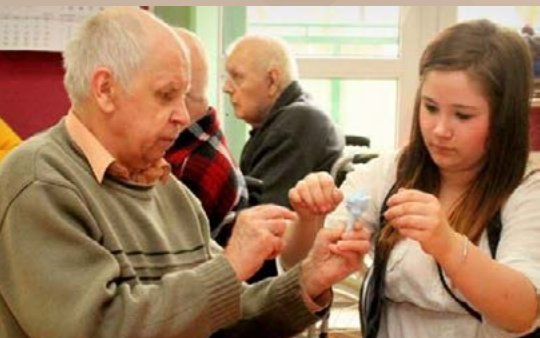
Wychowanki podczas zajęć w Domu Pomocy Społecznej w Nakle n. Notecią