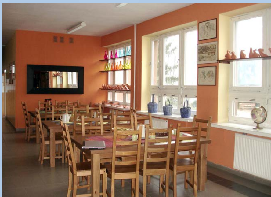
Zespół Szkół Publicznych w Radowie Małym

Jedną z placówek, gdzie zdecydowano się na zorganizowanie takiej przestrzeni, jest Zespół Szkół Publicznych w Radowie Małym. Miejsca z krzesłami i stołem dla uczniów, przy którym