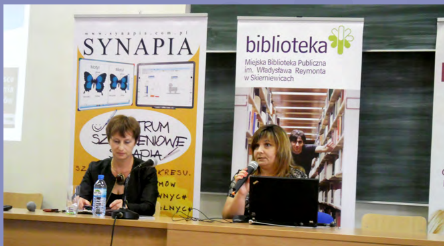
Konferencja Biblioteka w edukacji - edukacja w bibliotece

wykorzystujących TIK podczas lekcji i zajęć pozalekcyjnych, np. w zakresie tworzenia scenariuszy zajęć, materiałów do prowadzenia zajęć, w tym prezentacji multimedialnych, organizowania zajęć bibliotecznych dla uczniów z wykorzystaniem nowych technologii informacyjnych. Nauczyciele mogą pobrać materiały multimedialne i interaktywne ze strony internetowej biblioteki.