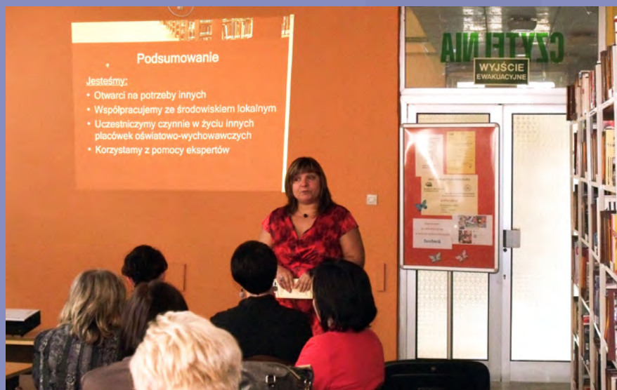
Konferencja Biblioteka przestrzeń otwarta

Budowanie systemu wsparcia opiera się również na upowszechnianiu i wykorzystywaniu nowoczesnych technologii informacyjno-komunikacyjnych w procesie edukacji uczniów i nauczycieli, którego celem jest zapewnienie dostępu do usług informacyjnych i bibliograficznych poprzez nowoczesne bazy komputerowe, prowadzenie zajęć z uczniami i szkoleń dla nauczycieli bibliotekarzy z wykorzystaniem TIK. Biblioteka udziela nauczycielom pomocy w nabywaniu i rozwijaniu kompetencji praktycznego stosowania metod dydaktycznych