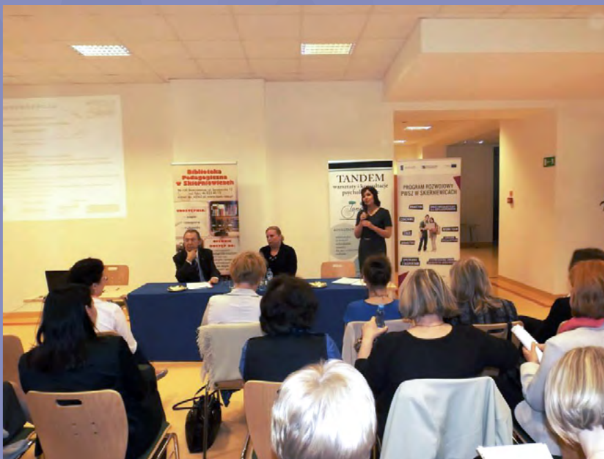
Konferencja Biblioteka partnerem szkoły w rozwijaniu zainteresowań czytelniczych dzieci i młodzieży

Następna konferencja Biblioteka partnerem szkoły w rozwijaniu zainteresowań czytelniczych dzieci i młodzieży była zorganizowana z okazji Tygodnia Bibliotek w 2014 r. i skierowana do nauczycieli bibliotekarzy, nauczycieli języka polskiego, wychowawców i innych zainteresowanych osób. Tematyka konferencji wynikała ze zdiagnozowanych potrzeb szkół, w których pojawia się problem czytelnictwa uczniów i kształtowania właściwych postaw