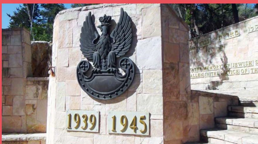
Upamiętnienie polskich żołnierzy II wojny światowej na Górze Herzla w Jerozolimie

„(...) Kompleksowe podejście do tematu Zagłady to następny pozytywny aspekt seminarium. Kluczową rolę odegrały zasoby Instytutu Yad Vashem, które dotyczą zagadnienia, wykorzy-