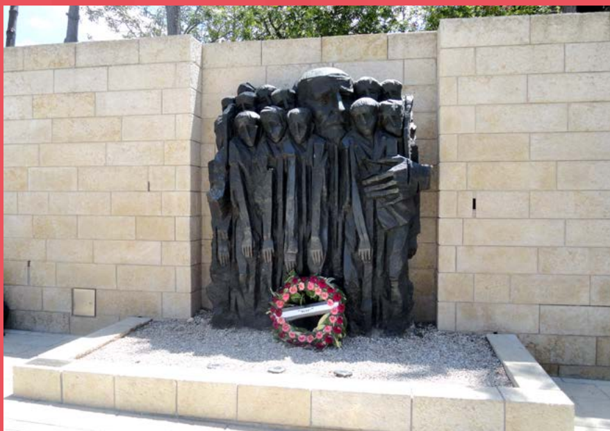
Pomnik Korczaka i Dzieci Getta

Uczenie się o Holokauście jako o doświadczeniu ludzkim wykracza poza granice dyscypliny historycznej. Dla-