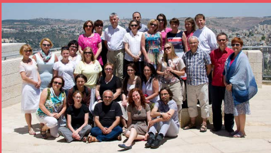
Grupa polskich nauczycieli i wykładawców seminarium w Yad Vashem, 8–19.08.2014

dostępne, a także sposób przedstawienia treści, dobór środków wizualnych, aranżacja przestrzeni, ilość materiałów zrobiły na mnie ogromne wrażenie. Ponownie spójność w przedstawianiu koncepcji i świadomość użycia każdego elementu od momentu wejścia osoby odwiedzającej do jej wyjścia, danie możliwości na przemyślenie tematu czy przeżycie emocjonalne w ostatnich salach były absolutnie bezbłędne. (...)