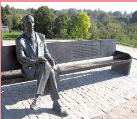
Ławeczka Karskiego w Łodzi

„Ci, którzy znali Jana Karskiego, nigdy go nie zapomną. Jego przesłanie będzie rozświetlać ścieżkę kochających wolność przez lata, które nadejdą. Nie można sobie wyobrazić lepszego dziedzictwa” – Bill Clinton