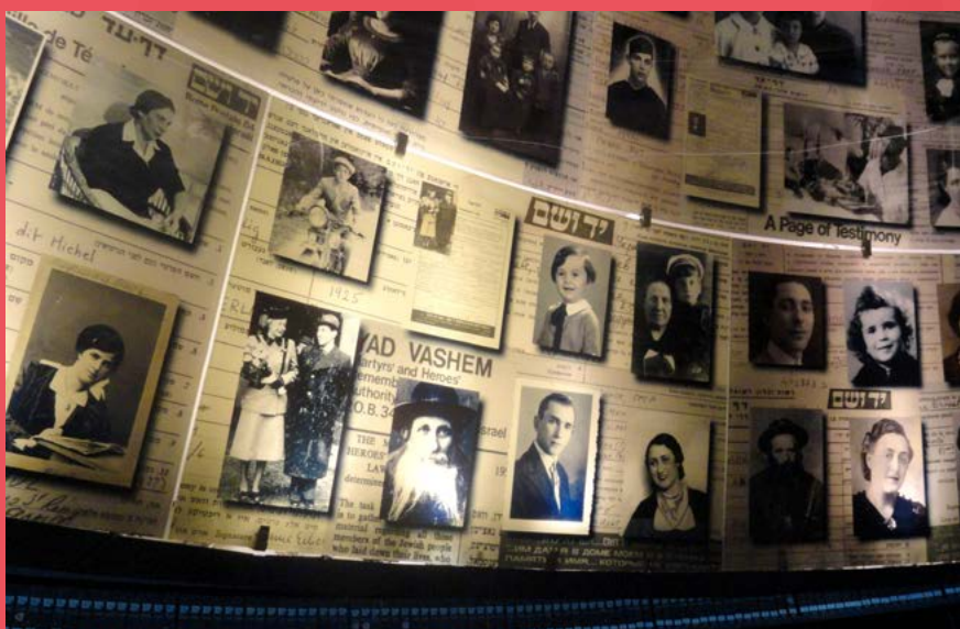
Sala Imion w Muzeum Historii Holokaustu, zawiera imiona i szczegóły osobiste milionów ofiar, zapisane w Listach Świadców

statystyki śmierci, łańcuch wydarzeń politycznych i wojskowych. To także