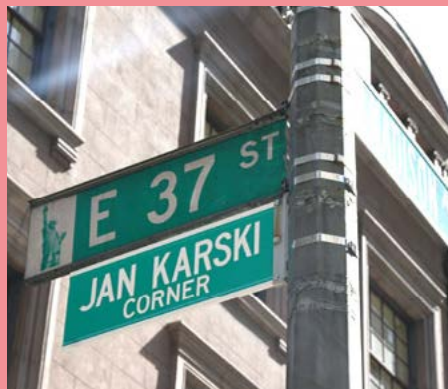
Ulica Karskiego na Manhattanie

Zapraszamy Państwa do odwiedzenia zakładki na stronie ORE i zapoznania się z sylwetką i historią tej niezwykłej postaci. Udostępniliśmy także dla Państwa kalendarz wydarzeń, które uświetnią obchody Roku Jana Karskiego, w tym informacje o działaniach edukacyjnych programu Jan Karski. Niedokończona misja .