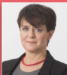
Joanna Kluzik-Rostkowska – Minister Edukacji Narodowej

Urodziła się 14 grudnia 1963 r. Absolwentka wydziału dziennikarstwa i nauk politycznych Uniwersytetu Warszawskiego.