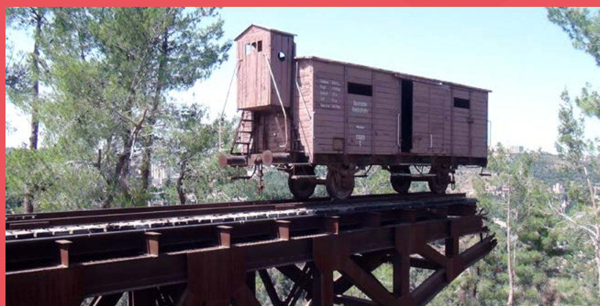
Wagon Towarowy – Pomnik Wysiedlonych

próba zrozumienia ludzi i tego, w jaki sposób radzili sobie z ekstremalnymi