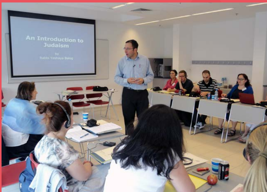
Wykład Rabina Yeshaya Baloga Istota judaizmu

stując różnorodne środki przekazu. Dla mnie szczególnie interesujące były zbiory w Centrum Wizualnym, a także kolekcja obrazów w Muzeum Sztuki Holokaustu. W czasie zajęć na seminarium zobaczyliśmy, jak można użyć poezji, malarstwa, filmu do zaintrygowania uczniów tematem, do wzbudzenia chęci poznania wydarzeń historycznych bądź też do włączenia zagadnień historycznych w czasie zajęć artystycznych czy lekcji języka polskiego. Wizyta w Muzeum Historycznym była niezwykle, zasoby tam