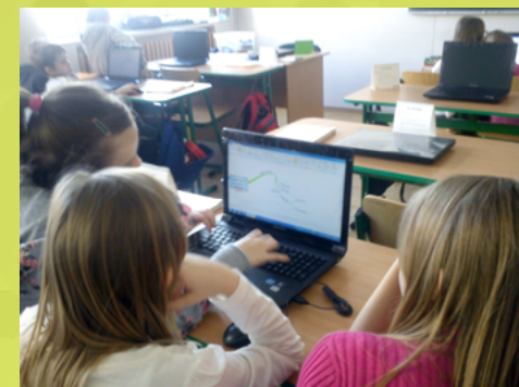
SP 12 w Białymstoku – lekcja matematyki – zajęcia z komputerem MATLADIA

Na wysokim poziomie spełnienia wymagania sprawowany przez dyrektora nadzór powinien prowadzić do podejmowania nowatorskich działań, innowacji i eksperymentów. Proces decyzyjny dotyczący szkoły powinien być demokratyczny – powinni brać w nim również udział wszyscy nauczyciele, inni pracownicy szkoły, rodzice oraz uczni-