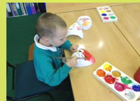
5-latek w szkolnej zerówce – wykonujemy maski