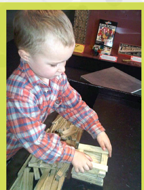
5-latek w szkolnej zerówce – co mogę zrobić z tych deseczek