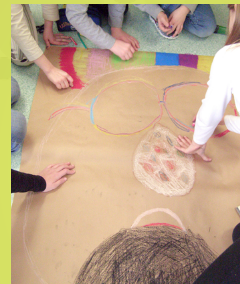
SP 12 w Białymstoku – lekcja jęz. polskiego – kleksografia; robimy wspólną pracę

Każdy uczeń to indywidualna osobowość o specyficznych zdolnościach, możliwościach psychofizycznych, preferencjach, potrzebach, Proces uczenia się jest zależny nie tylko od indywidualnych możliwości i zdolności uczniów. Duży wpływ odgrywa też często sytuacja rodzinna i środowisko ucznia. W wymaganiu tym zwracamy uwagę przede wszystkim na to, czy szkoła posiada pełną świadomość czynników determinujących proces uczenia się (możliwości psychofizycznych, potrzeb rozwojowych, sposobów ▶