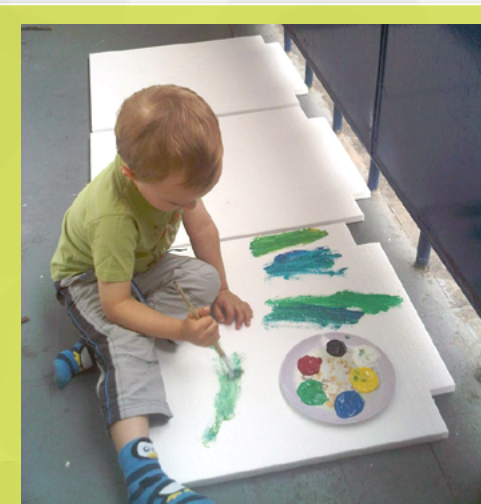
5-latek w szkolnej zerówce – malowanie farbami jest super

Z punktu widzenia wizytatorów ds. ewaluacji ważną zmianą jest wydłużenie terminu na sporządzenie raportu z ewaluacji: ▶