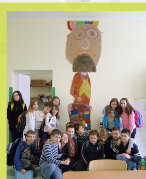
SP 12 w Białymstoku – lekcja jęz. polskiego w kl. IV – zbiorowy efekt naszej pracy

Istota tego wymagania to występowanie wzajemnego rozwoju, odniesienie korzyści wzajemnych, czyli zarówno dla szkoły, jak i współpracujących podmiotów. W wymaganiu ważne jest przede wszystkim rozpoznanie potrzeb i zasobów szkoły lub placówki oraz środowiska lokalnego i dopiero na tej podstawie podejmowanie inicjatyw na rzecz wzajemnego rozwoju. Działania muszą bowiem być adekwatne do zdiagnozowanych potrzeb. Wartością jest też systematyczność ►