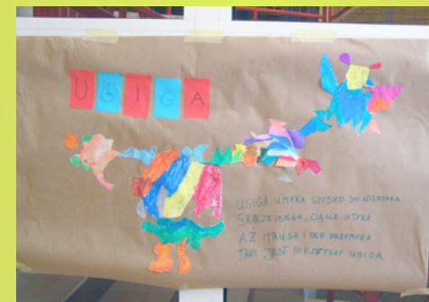
SP 12 w Białymstoku – lekcja jęz. polskiego – kleksografia w oparciu o Akademię Pana Kleksa