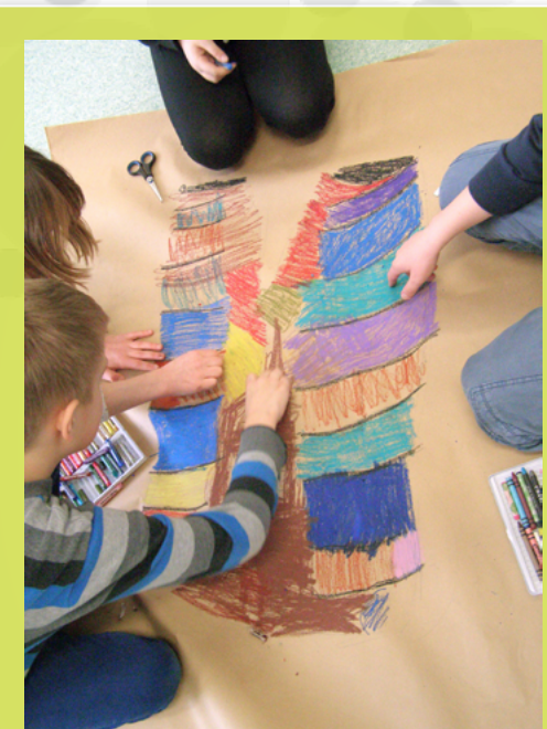
SP 12 w Białymstoku – lekcja jęz. polskiego w kl. IV – kleksografia w oparciu o Akademię Pana Kleksa

Jednym z priorytetów współczesnej szkoły jest promowanie wśród uczniów wartości uczenia się. Człowiek musi bowiem ciągle rozwijać swoje umiejętności i kompetencje, by móc zrozumieć zmiany zachodzące w dzisiejszej rzeczywistości, móc sprostać oczekiwaniom i wymaganiom stawianym przez współczesny świat. Szkoła powinna więc z jednej strony uświadomić im konieczność uczenia się przez całe życie, z drugiej zaś przekonać ich, że nauka jest pasjonująca, ciekawa. Jak powiedział Albert Einstein, „Nauka w szkołach powinna być prowadzona w taki sposób, aby uczniowie uważali ją za cenny dar, a nie za ciężki obowiązek”. Promowanie wartości edukacji to liczne działania ▶