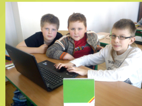
SP 12 w Białymstoku – jęz. polski z mapą myśli iMAINDMAP

Należy więc zwracać uwagę na adekwatność procesów edukacyjnych do osiągnięć uczniów w poprzednim etapie edukacyjnym oraz ich spójność z zalecanymi warunkami i sposobami realizacji podstawy programowej. Wartość ma też powszechne monitorowanie i diagnozowanie osiągnięć uczniów oraz wdrażanie wniosków z analiz. Na wysokim poziomie spełnienia wymagania istotna jest skuteczność wdrażanych wniosków, przejawiająca się wzrostem efektów uczenia się oraz osiąganiem przez uczniów różnorodnych sukcesów edukacyjnych. Ważne jest też, by podejmowane w tym zakresie działania szkoły przygotowały uczniów do kolejnych etapów kształcenia i/lub funkcjonowania na rynku pracy. ▶