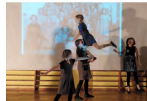
Spektakl „Pasje niespełnione”