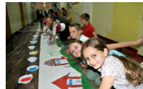
Dzień Rodziny: Wielkie malowanie