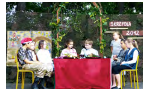
Sobótka: Poskramianie złoŹnicy