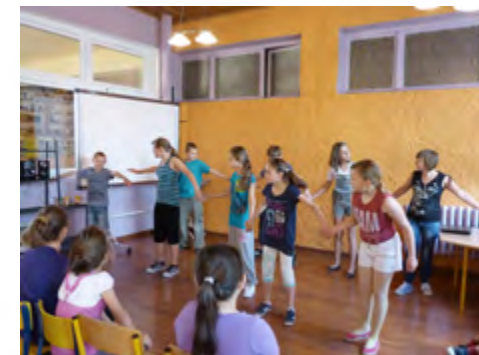
Konferencja Samorządu Szkolnego

MK: Stowarzyszenie zostało zarejestrowane w 2006 r. z mojej inicjatywy. Jego celem jest stwarzanie ram organizacyjnych do wspólnej pracy, wymiany myśli i doświadczeń nauczycieli, wychowawców, rodziców oraz innych osób inspirowanych wspólną pracą na rzecz szkoły, przedszkola i dzieci w Moszczance, na zasadach kreatywnego współuczestnictwa wszystkich jego członków. Stowarzyszenie ▶