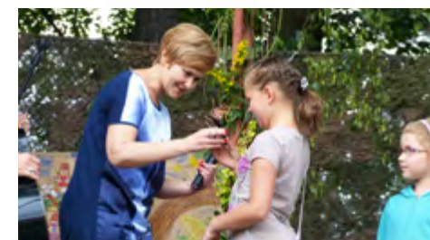
Sobótka: Skrzydła 2012