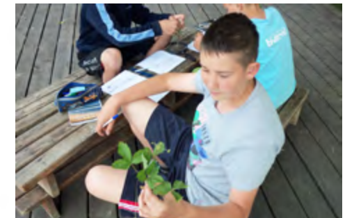
Praca z fiszką prowadzącą: budowa rośliny okrytonasiennej