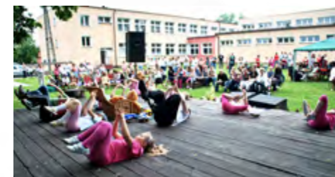
Dzień Rodziny: Występy na letniej scenie