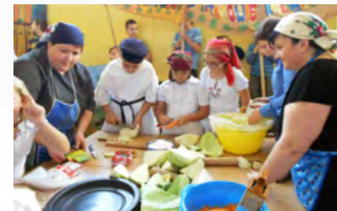
Wspólne kisanie kapusty