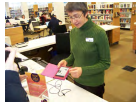
Bibliotekarz prezentuje jeden z czytników dostępnych w bibliotece publicznej w Champaign w Illinois