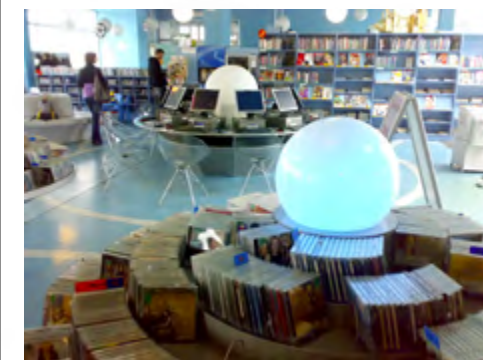
Zasoby muzyczne Mediateki Planeta 11 w Olsztynie

Jak podkreślił prezydent Olsztyna, mediateka działająca w tym mieście to przede wszystkim różnorodne usługi oraz instytucja, w której użytkownicy są podmiotem wielu działań. „Wpływają oni w istotny sposób na zakup zbiorów, dzięki czemu ponad 95% z nich jest wypożyczone. Stają się krea- ▶