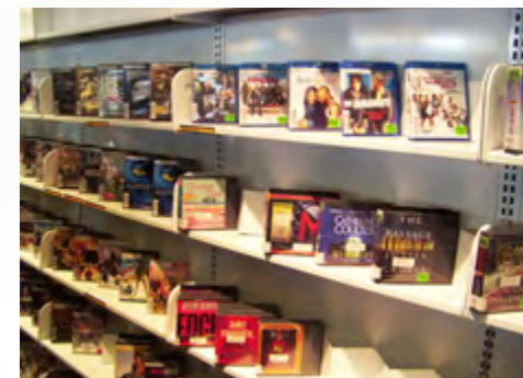
Fragment kolekcji płyt DVD i Blu-ray w bibliotece publicznej w Champaign w Illinois

Elementem działalności bibliotek publicznych, który wzbudza podziw i uznanie, jest wolontariat. W codzienności funkcjonowania amerykańskich instytucji kultury stanowi on dość powszechne zjawisko (np. Biblioteka Publiczna Hrabstwa Arlington ▶