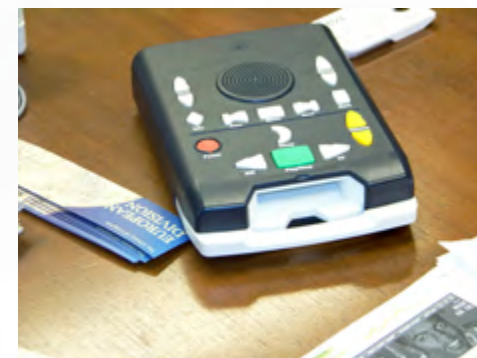
Urządzenie do odtwarzania audiobooków zapisanych na kasecie z pamięcią flash – zasoby Biblioteki Kongresu w Waszyngtonie

Jakie kompetencje musi posiadać dzisiaj bibliotekarz, aby sprostać tak kreatywnej roli bibliotek? Na pewno powinien zdawać sobie sprawę z szybko zmieniającej się rzeczywistości świata informacji, lawinowego przyrostu wiedzy, jej szybkiej dezaktualizacji oraz ogromnej ilości multimedialnych przekazów docierających do ludzi z różnych stron. W swojej pracy powinien również dużą wagę przywiązywać do edukacji informacyjnej czytelników. Za Ewą Kurkowską przyjmijmy, że ta edukacja to nic innego, jak przygotowywanie czytelników do efektywnego posługiwania się informacją. Jest to też cały szereg działań dydaktyczno-wychowawczych mających na celu wyszukiwanie, analizowanie, selekcję, właściwe stosowanie informacji, a także rozwijanie krytycznego myślenia (zwłaszcza u młodych czytelników) czy kształtowanie odpowiednich postaw odnoszących się do jej wykorzystania – mam tu na myśli kwestie prawne i etyczne (Kurkowska, 2012, s. 10). ▶