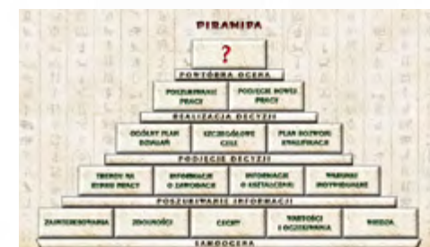
Rysunek 1. Piramida kariery opracowana przez firmę Progra

Drugim etapem działań, według piramidy, jest poszukiwanie informacji o świecie zewnętrznym. Skoro znam już samego siebie, to muszę teraz dowiedzieć się, jak ten swój potencjał najlepiej wykorzystać, jaką wy-