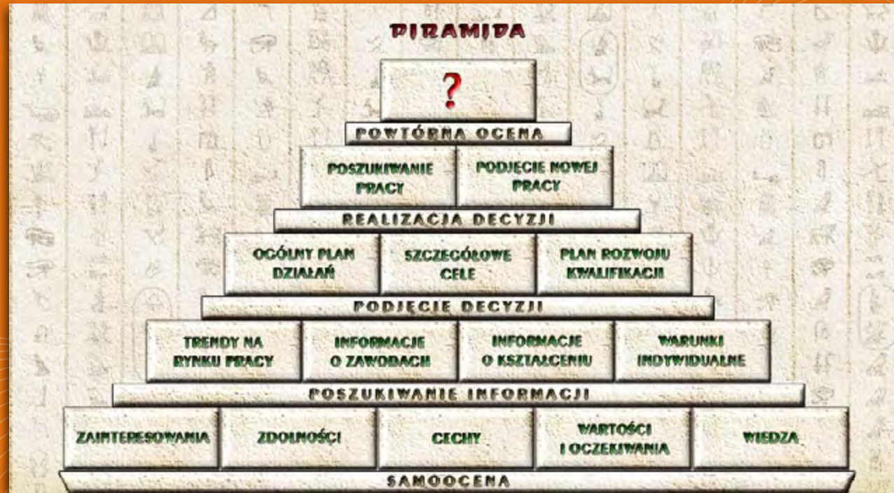
Rysunek 1. Piramida kariery opracowana przez firmę Progra