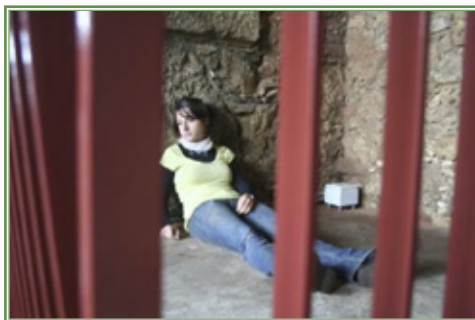
Fot. 3 – wypadek uczennicy na wycieczce a zastosowanie apteczki

Warto zaznaczyć, że na zadanie opracowania w formie dowolnej prezentacji przez ucznia należy przeznaczyć 10 minut. Zaś na prezentację zagadnienia optymalnie 3-4 minuty.