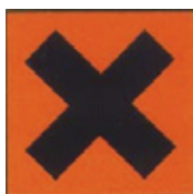
substancja podrażniająca skórę