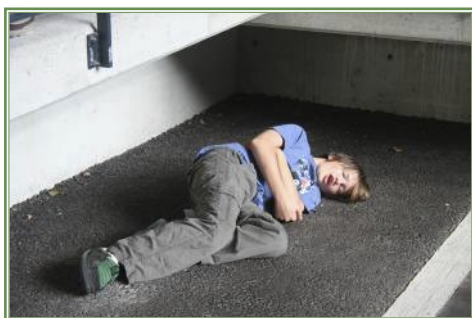
Fot. 1 – symulacja scenki wypadku ucznia w szkole

Na koniec „poszkodowany” omawia swoje spostrzeżenia, a „przypadkowy życzliwy” dzieli się wrażeniami z etapów udzielania pierwszej pomocy.