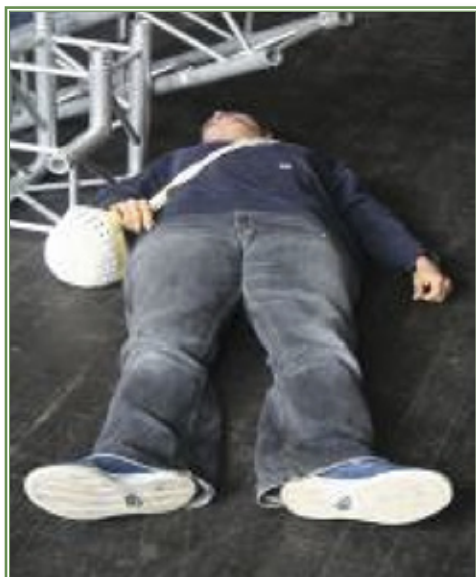
Fot. 4 – osoba „poszkodowana” w scenie układanie w pozycji bezpiecznej

Niezwykle ważnym elementem wyżej wymienionych ćwiczeń jest tzw. gra . Polega ona na właściwym dobraniu czterech podstawowych elementów. Są nimi: