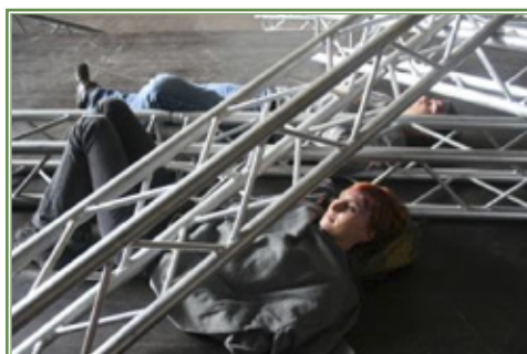
Fot. 2 – świat w oczach osoby poszkodowanej jest inny niż osób zdrowych

Jednym z ciekawych sposobów podtrzymywania nawyków gotowości do udzielania pomocy jest działalność w szkolnym hufcu organizacji harcerskiej lub w szkolnym kole Polskiego Czerwonego Krzyża. W ten sposób można uczynić pierwszą pomoc bliską uczniom między zajęciami w ramach cyklu edukacji dla bezpieczeństwa!