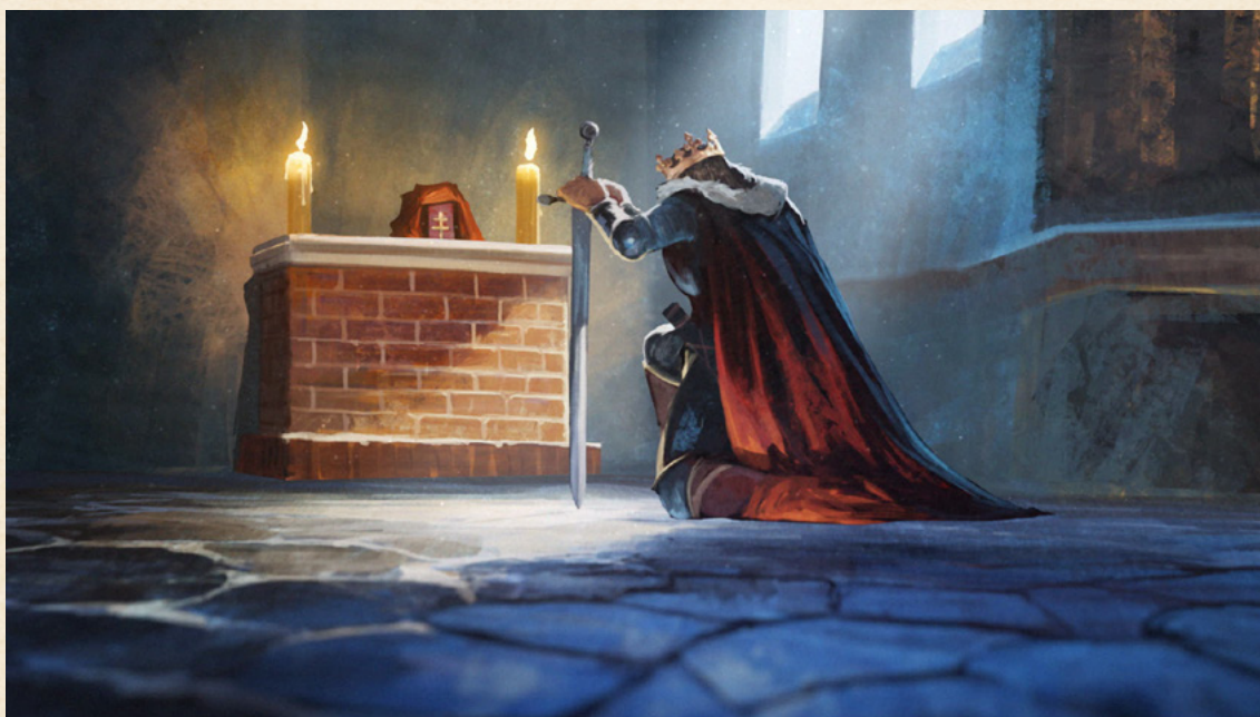
Król Władysław Jagiełło na Świętym Krzyżu – kadr z filmu O chrześcijańskich korzeniach Polski

benedyktynski na Świętym Krzyżu stanowił centrum kultu i nauki. Jeszcze większe znaczenie zyskał z chwilą, gdy na początku XIV wieku książę Władysław Łokietek przekazał benedyktynom relikwiarz z fragmentem Drzewa Krzyża Świętego. Od tej chwili klasztor stał się centrum kultu Krzyża Świętego. Dużym szacunkiem obdarzał to miejsce król Władysław Jagiełło, pielgrzymując tu niejednokrotnie. Jedną z pielgrzymek była szczególnie – przed rozpoczęciem Wielkiej Wojny z Krzyżakami i najważniejszym starciem pod Grunwaldem. Widocznym symbolem szczególnego kultu Grobu i Krzyża Pańskiego u Władysława Jagiełły może być drobny szczegół heraldyczny – w osobistym herbie umieścił Władysław symbol podwójnego krzyża – znany nam już z płaszczy bożogrobców oraz relikwiarza z klasztoru na Świętym Krzyżu.