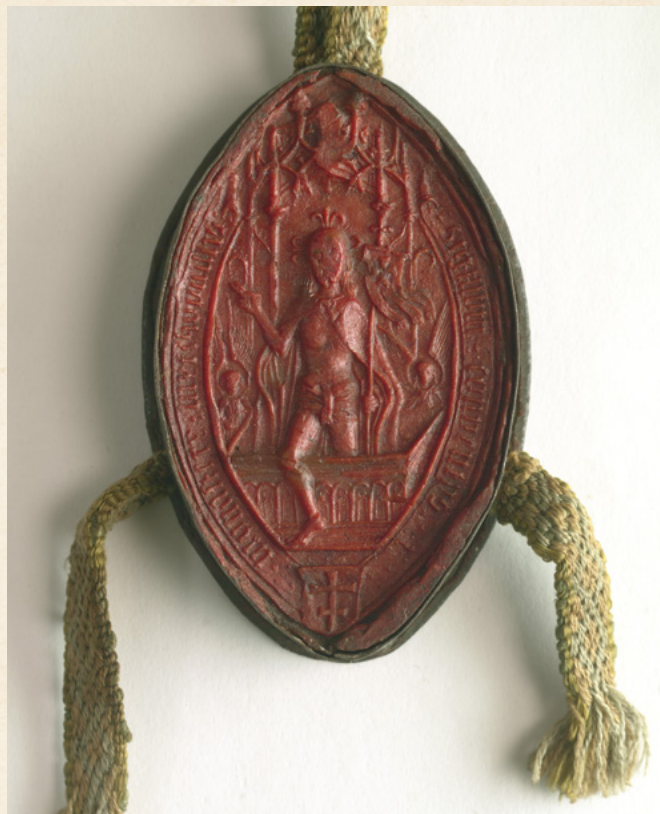
Pieczęć bożogrobca – kadr z filmu O chrześcijańskich korzeniach Polski

Bożego, czego widocznym śladem jest wykorzystanie symbolu podwójnego krzyża w ich heraldyce – oznaczające również, że ukształtowana we wczesnym średniowieczu tradycja jest żywa do dziś.