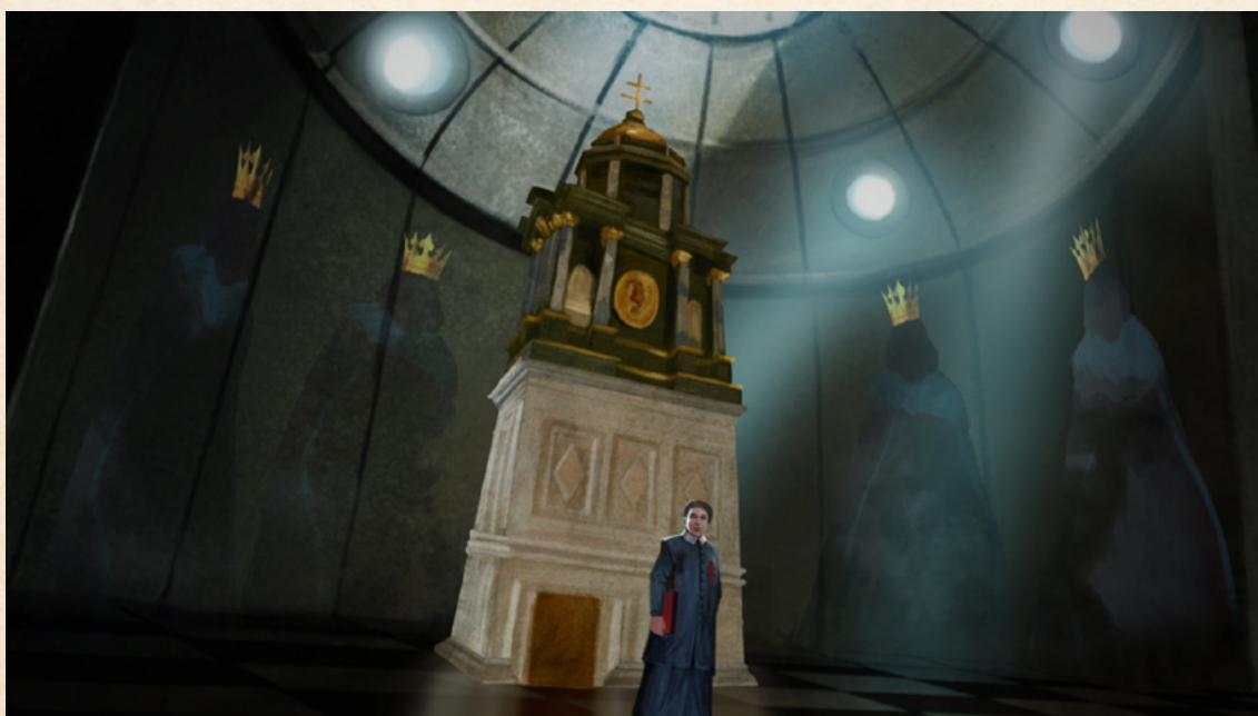
Grób Chrystusowy w Miechowie – kadr z filmu O chrześcijańskich korzeniach Polski

uzyskał szereg przywilejów – w tym przywilej odpustu zupełnego, jaki posiadał grób jerozolimski. Popularność Miechowa spowodowała, że budynek okazał się za mały i pod koniec XIV wieku wzniesiono duży gotycki zespół składający się z trójnawowej bazyliki i budynku klasztornego. Miechów stał się centrum wiedzy i nauki. W tamtejszych skryptoriach przepisywano dzieła średniowiecznych filozofów i ojców kościoła. To bożogrobcy opracowali oraz upowszechniali uroczyste obchody Triduum Paschalnego, a najstarszy polski zbiór homilii, tzw. Kazania świętokrzyskie , powstał prawdopodobnie w tamtejszym skryptorium. W Miechowie krzyżowały się drogi różnych pielgrzymów mających rozmaite potrzeby – biednych i bogatych, żebraków i królów – tu warto wspomnieć o Kazimierzu Wielkim, Władysławie Jagiellu (w Miechowie był aż siedemnaście razy), Zygmuncie Starym, Zygmuncie Auguście, czy Stefanie Batorym, Zygmuncie III Wazie i Janie Kazimierzu. Ojcowie swoimi posługami służyli leczeniu w szpitalu nie tylko ciał przybyłych, ale także ich dusz – poprzez udzielane porady duchowe. Kult Bożego Grobu rozszerzał się w całej Polsce i objął na przestrzeni kolejnych wieków trzydzieści miejsc – od Przeworska, przez Nysę po Żagań, Głogówek i Wejherowo.